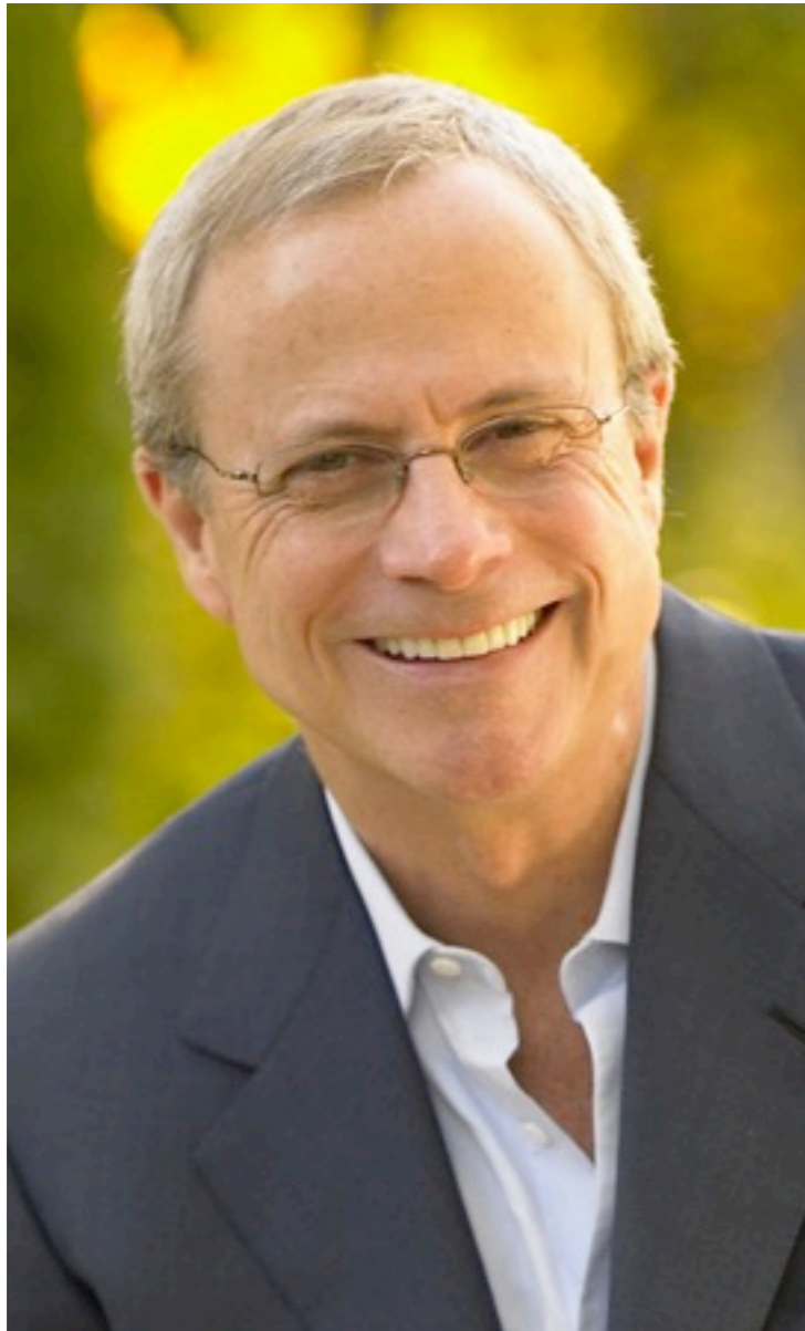
Дэвид Аллен гуру в области личной продуктивности