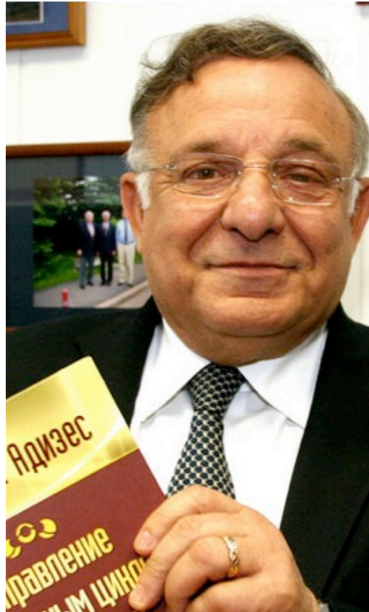
Ицхак Адизес гуру в области менеджмента