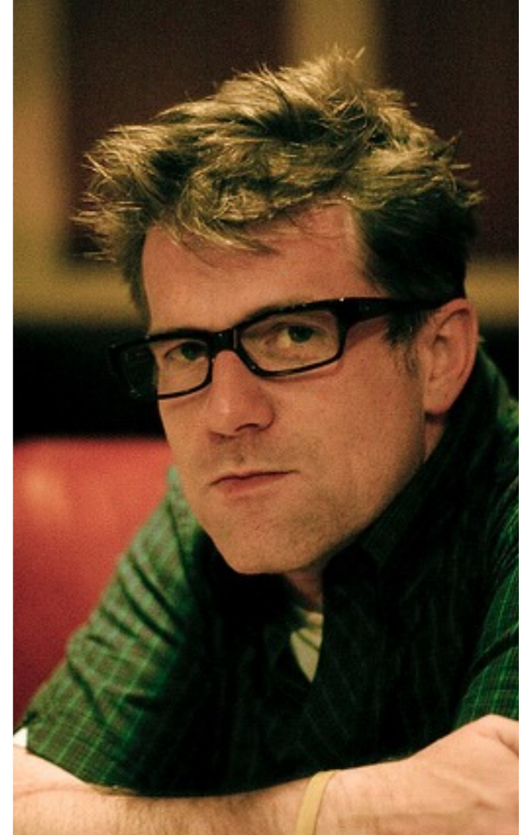
Мерлин Мэнн основатель ресурса « 43 folders »